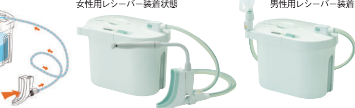
男性用レシーバー装着状態

■サイズ:幅23.3×奥行37.8×高さ27.3cm ■尿タンク容量:3ℓ ■重量:5kg ■電源:AC100V ■電源コード長さ:約2.5m