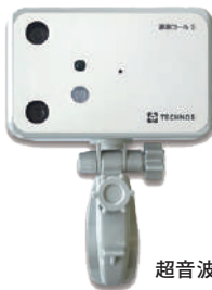
超音波・赤外線センサー K